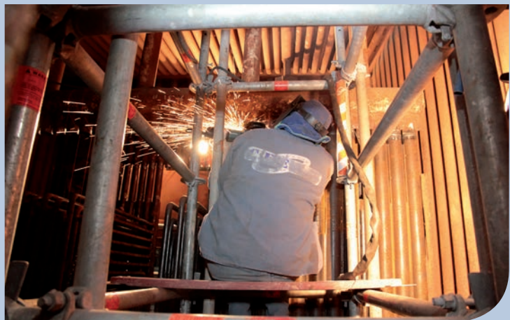
Travaux sur la chaudière de l'usine d'incinération

Enfin, la Communauté d'Agglomération a choisi de privilégier les circuits courts pour le traitement des déchets et s'appuie sur des filières