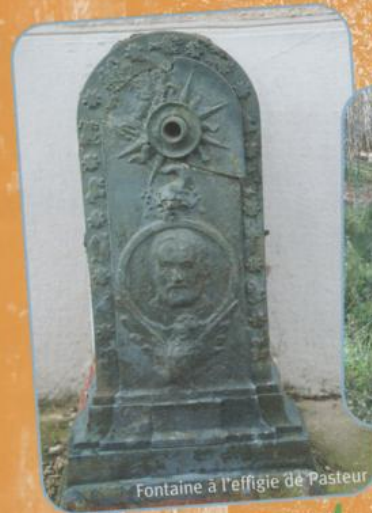
Fontaine à l'effigie de Pasteur

Le Sucré - La Grande Hâte Le Ru du Crot Guenin