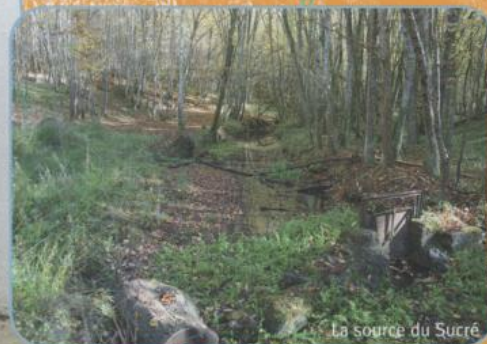
La source du Sucré

Le village de Dixmont vous propose plusieurs sentiers promenade accessibles à tous. Nos fiches sont à votre disposition au secrétariat de la mairie.