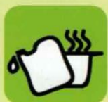
huiles de vidanges huiles végétales