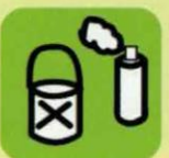
peintures produits chimiques de ménages