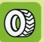
pneumatiques VL encombrants propres, secs, déjantés (sauf poids lourds)