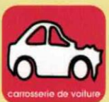
carrosserie de voiture adressez vous à un garagiste