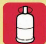
bouteille de gaz

La déchèterie de ROUSSON est réservée aux personnes dont la résidence principale ou secondaire se trouve sur une des communes du syndicat mixte du Villeneuvien.