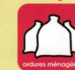
ordures ménagères laissez les dans vos bacs roulants