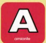
amiante s'adresser à une société agréée ou nous contacter