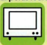
écrans TV ordinateurs