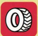
pneumatiques PL (poids lourds) tracteur, sales, coupés