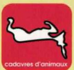
cadavres d'animaux renseignez-vous auprès d'un vétérinaire