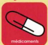
médicaments déposez les dans vos pharmacies